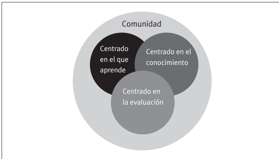
Figura 1. Perspectivas sobre ambientes de aprendizaje

El resto de este capítulo está organizado alrededor de la figura 1, la cual ilustra cuatro perspectivas sobre ambientes de aprendizaje que parecen particularmente importantes, dados los principios de aprendizaje discutidos en los capítulos anteriores. Si bien las discutimos en forma separada, estas perspectivas requieren ser conceptualizadas como un sistema de componentes interconectados que se apoyan mutuamente (por ejemplo, Brown y Campione, 1996). Primero expondremos cada perspectiva por separado y luego describiremos cómo se relacionan.