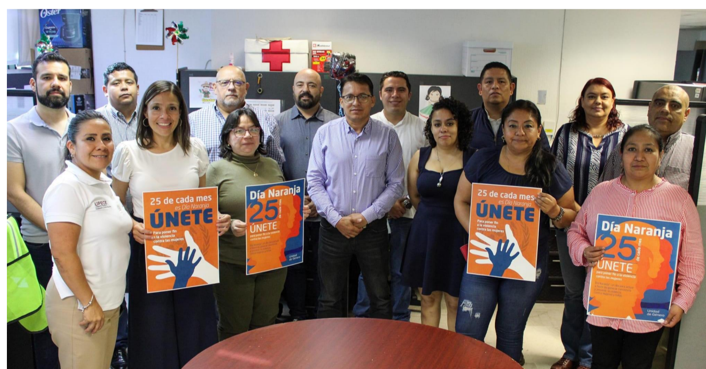
Personal de la UPECE, promoviendo la Campaña ÚNETE, para poner fin a la violencia contra las mujeres.