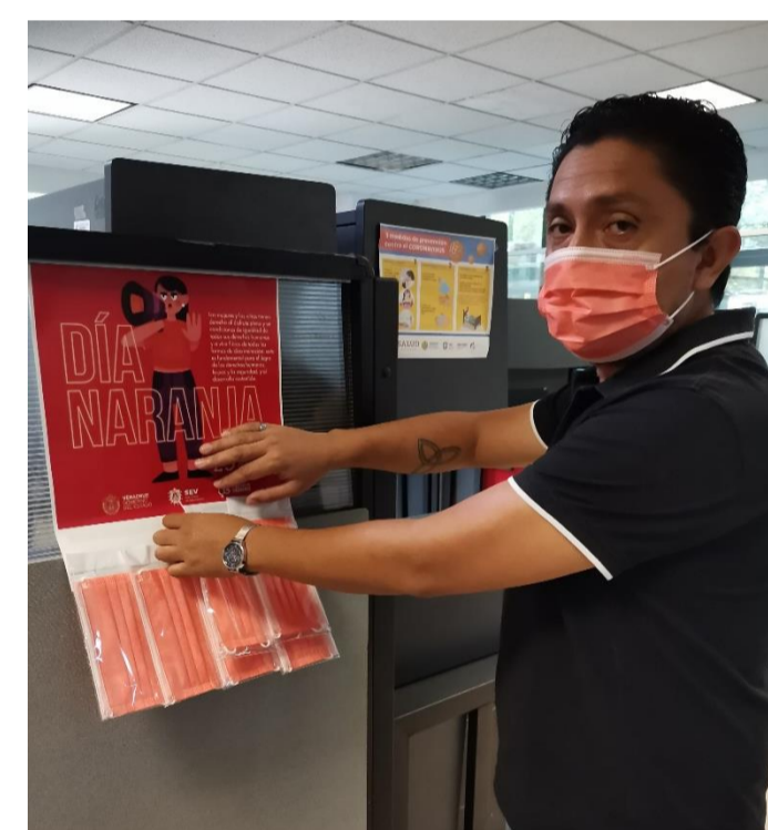
La Subdirección de Investigación y Análisis de la Información, compartiendo distintivos naranjas los días 25 de cada mes.