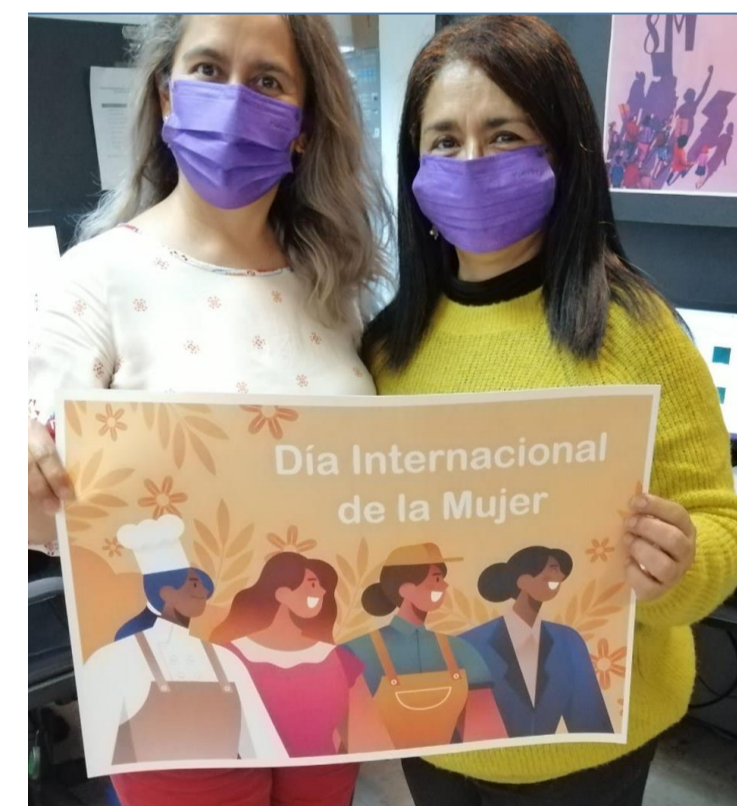
En la UPECE se conmemora el Día Internacional de la Mujer cada 8 de Marzo.

“Por un mundo donde seamos socialmente iguales, humanamente diferentes y totalmente libres”.