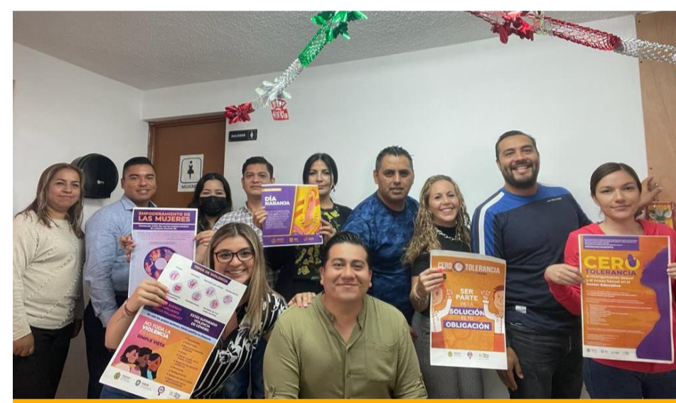
Personal de la Subdirección de Administración Escolar, en la promoción de acciones de la Campaña Cero Tolerancia al Hostigamiento Sexual y Acoso Sexual en el Sector Educativo.