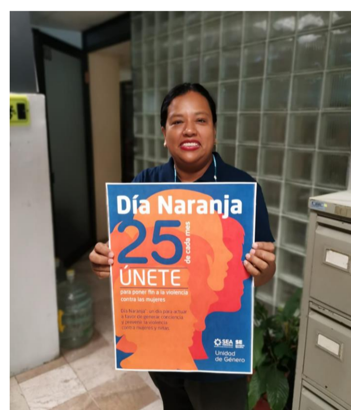
El Área del Programa CURP, se solidariza con las acciones promovidas desde la Unidad de Género.