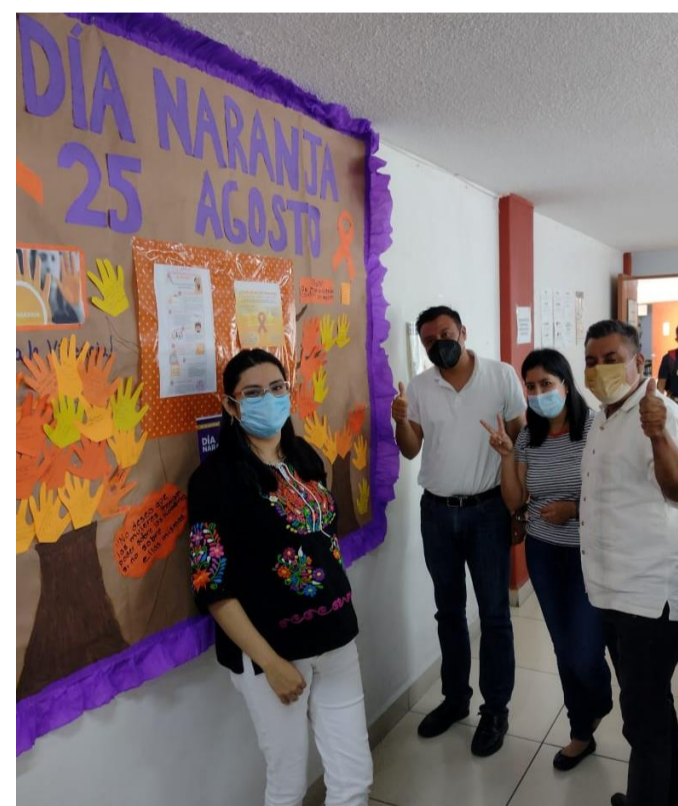
Personal de la Subdirección de Administración Escolar en la elaboración del Periódico Mural para la Igualdad de Género.