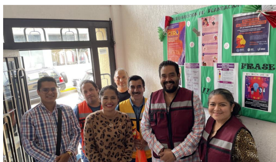
La Subdirección de Planeación, al igual que todas las demás áreas de la UPECE, promueven los temas de género con la instalación de periódicos murales en espacios comunes.

Dichas acciones dan constancia de la participación de las Subdirecciones de Planeación, de Evaluación, de Administración Escolar, y de Investigación y Análisis de la Información; así como del Programa CURP y del área del titular de la Unidad.