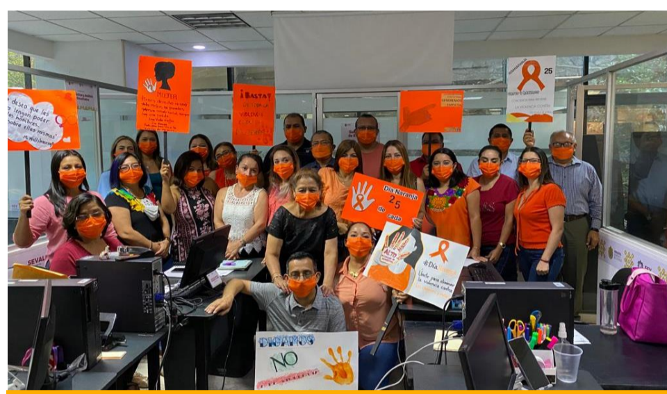
La Subdirección de Evaluación programa actividades diversas para los días 25 de cada mes, en esta imagen, la elaboración de carteles de Día Naranja.