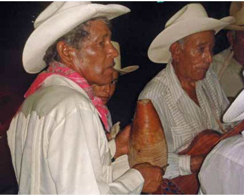
Foto 15. En la región de Los Tuxtlas y la sierra de Santa Martha sobrevive la utilización de güiro y el violín en la interpretación del son jarocho.

guitarrillas, bandolas y vihuelas que los españoles trajeron a América a principios del siglo XVI, dotación emparentada directamente con la familia de los instrumentos renacentistas y barrocos europeos, periodos con los que el son jarocho guarda cercanos vínculos musicales.