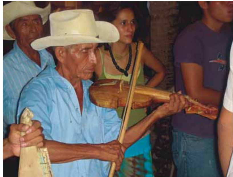
Foro 13. En la región de Los Tuxtlas sobrevive la utilización del violín para ejecutar el son jarocho.

La “guitarra de son” está emparentada directamente con la bandola del siglo XVI y su encordadura consta de cuatro, a veces, cinco, cuerdas que se puntean con un plectro —llamado “espiga” o “pluma”— hecho de cuerno de res. Se fabrica en diversos diseños y, al menos, en cuatro tamaños distintos; éstos son, de grave a agudo: “guitarra cuarta”, “requinto jarocho”, “medio requinto” y “requinto primero”. La guitarra