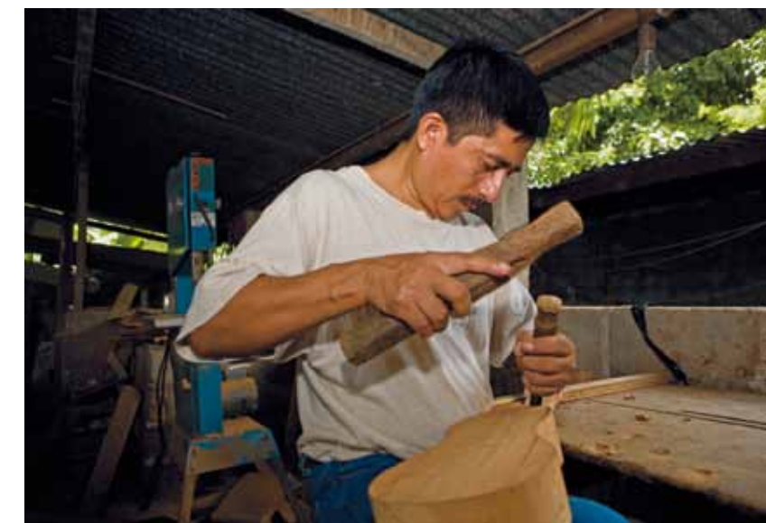
Foto 11. Un elemento esencial de la tradición musical jarocho es la fabricación artesanal de los instrumentos a la manera antigua: de una sola pieza de madera, escarbados y con sobria ornamentación.

ella, el carácter ceremonial, la magia, el misticismo y la alegría que produce el hecho de reunirse conviven de una manera estrecha y natural.