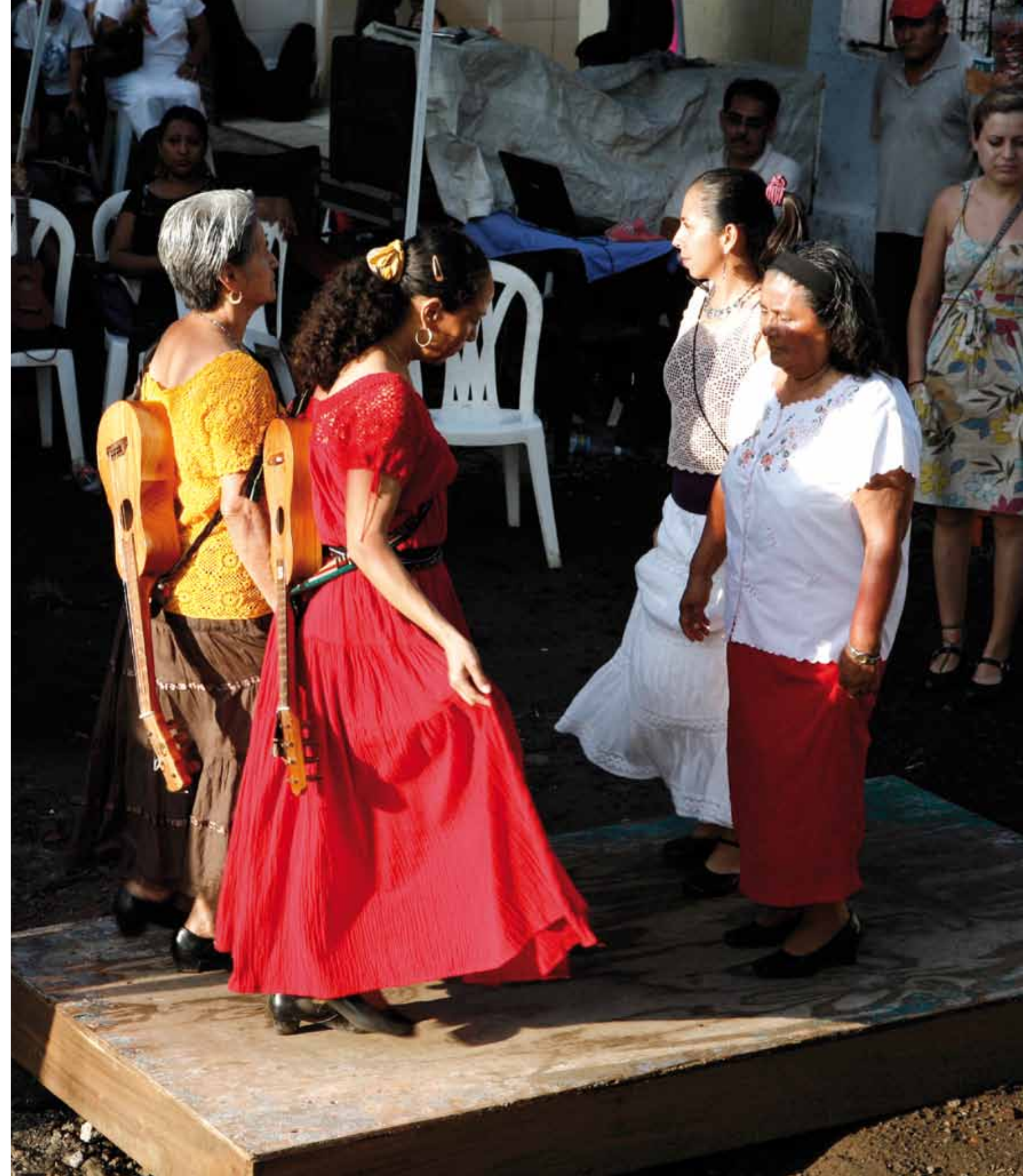
Foto 6. La tarima no es un escenario para el lucimiento de los bailarines, sino un auténtico instrumento de percusión.

Esos mismos años ochenta marcaron también el inicio de un esfuerzo sistemático para recuperar y revalorar la música mestiza tradicional, especialmente el son jarocho, que había pasado por un periodo de olvido. Los encuentros de jaraneros, que se celebraban en Tlacotalpan a partir de 1978 en el marco de las fiestas de la Candelaria crecieron y alcanzaron públicos muy amplios, tanto en el evento en sí como a través de su difusión en la radio. Pronto el son jarocho desbordó Tlacotalpan y los encuentros de jaraneros se multiplicaron por los pueblos y ciudades del sur, arraigándose en Minatitlán, Coatzacoalcos, Las Choapas, Acayucan, Cosoleacaque, Sotepapan, Hueyapan de Ocampo, Playa Vicente, San Andrés Tuxtla y Santiago Tuxtla. Los