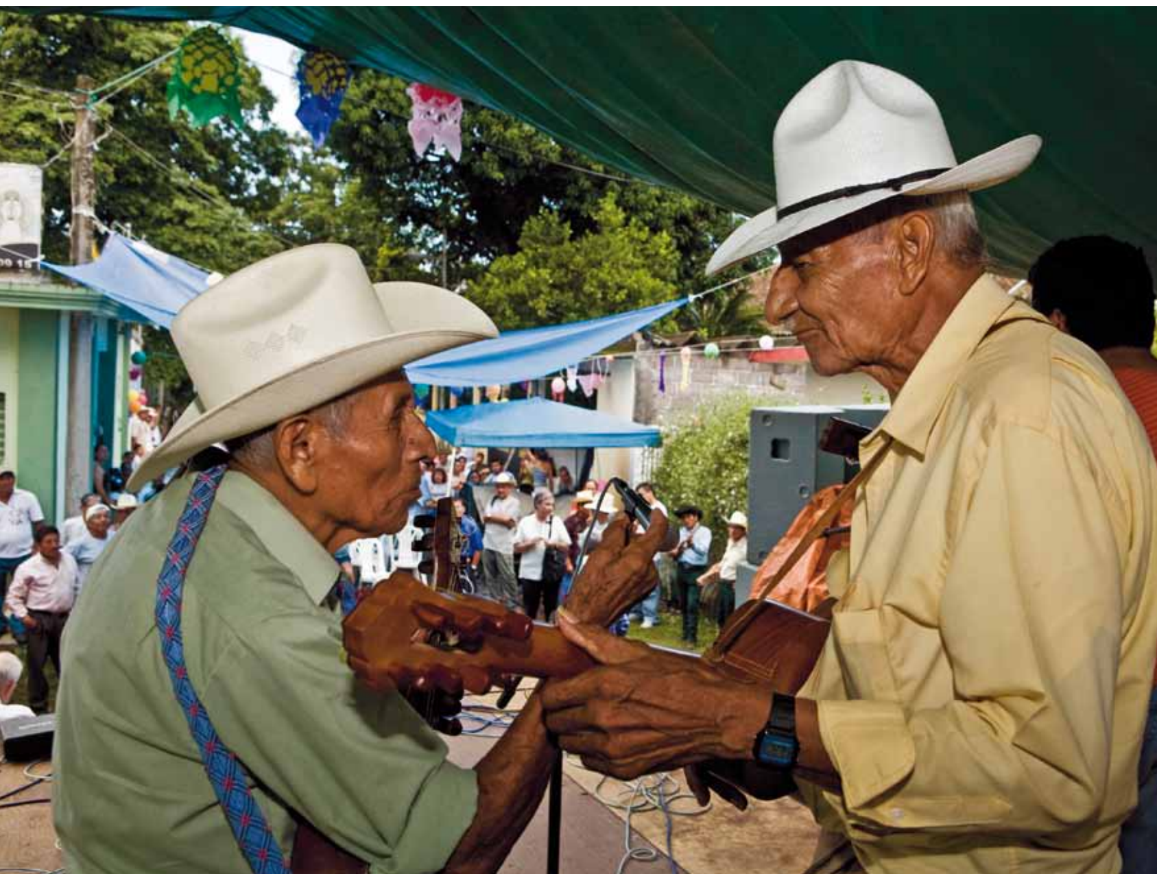
Foto 8. Soneros preparándose para tocar en Tlacotalpan.

imprimieron un sello local a tonadas, melodías y estructuras dancísticas y literarias de muy variada procedencia. Tales raíces la vinculan a fuentes europeas provenientes principalmente de España, del continente africano, así como a influjos culturales que la hermanan con otros géneros campiranos de América continental y del Caribe —como es el caso de la música guajira de Cuba, la jíbara de Puerto Rico, la llanera de Colombia y Venezuela, y hasta con expresiones musicales y dancísticas rurales de Santo Domingo—. El Caribe representó durante siglos una extensa región geográfica, económica y cultural a la cual Veracruz estuvo estrechamente vinculada a través del comercio marítimo, dado que su puerto principal