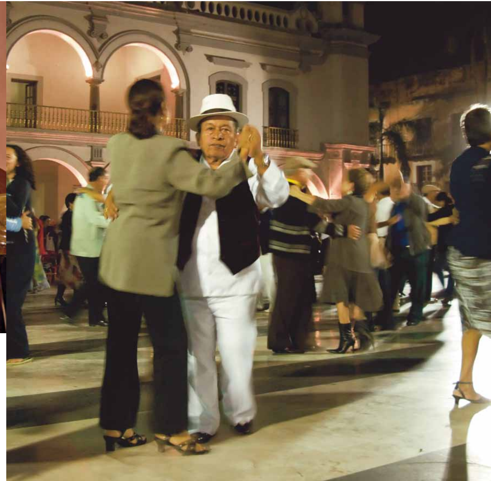
Foto 5. Danzoneros en la Plaza de Armas en el puerto de Veracruz.

El resultado es que la música mestiza del centro Veracruz es sin duda uno de los elementos más conocidos y fácilmente