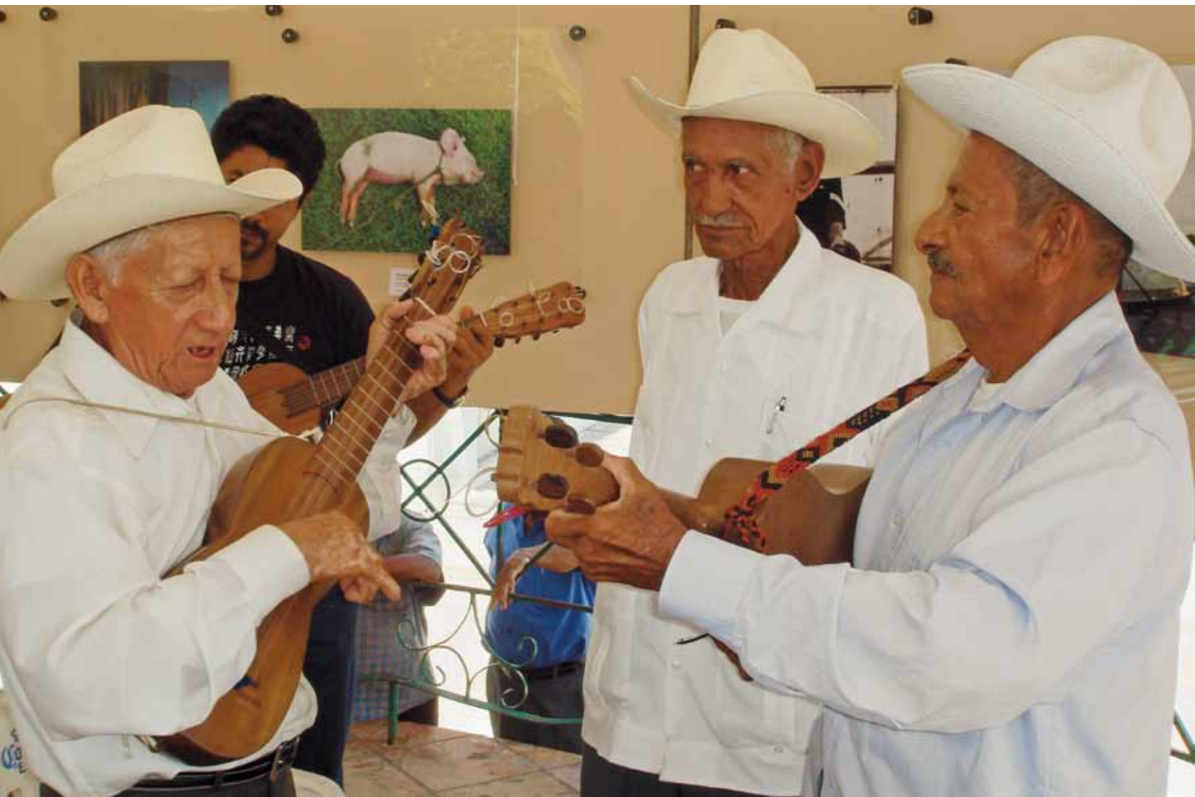
Foto 3. Viejos soneros.