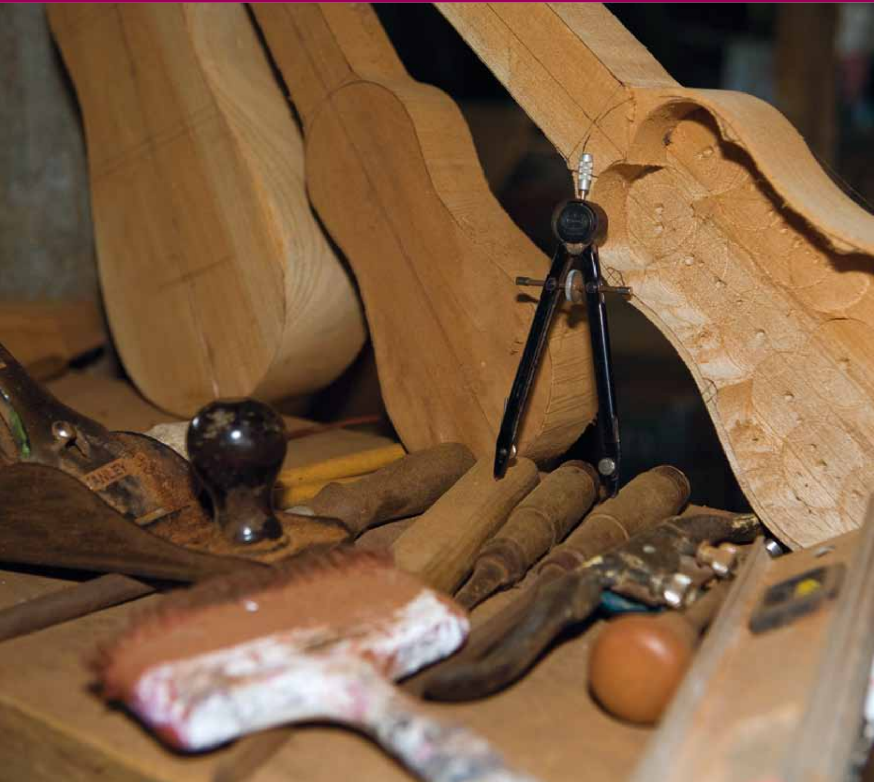
Taller de laudería (detalle).