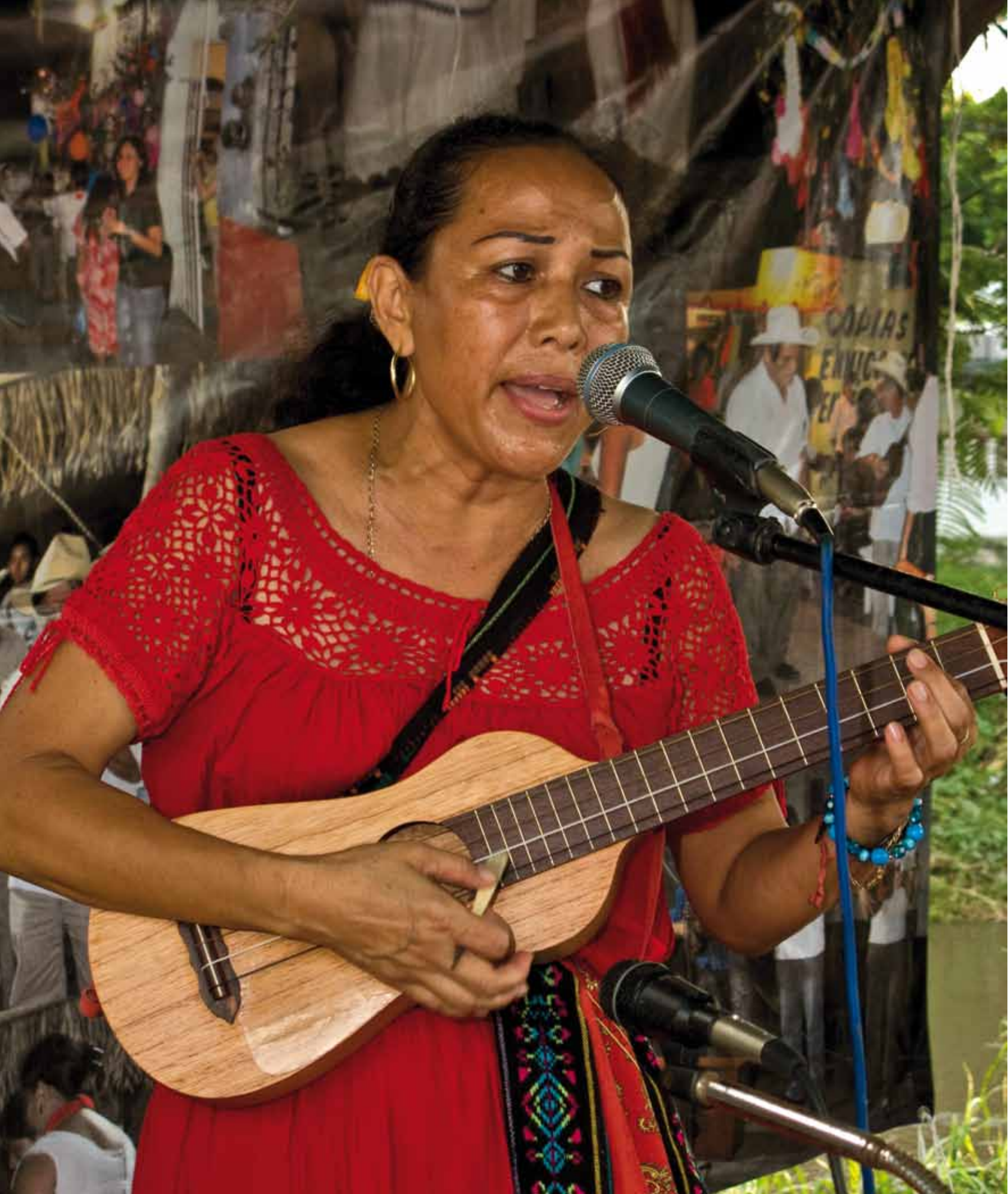
Foto 7. Cantante en la región de Tlacotalpan.

encuentros de jaraneros y los fandangos tomaron carta de naturalización inclusive en ciudades donde el son había sido poco significativo o donde nunca tuvo presencia, como la ciudad de Veracruz, Córdoba, Xalapa, Coatepec, Misantla y Martínez de la Torre.