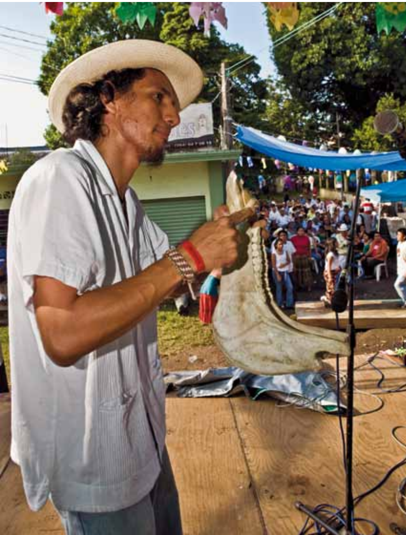
Foro 12. Un auténtico instrumento del África negra, la “quijada de burro”, es otro de los instrumentos usados en algunas de las comunidades del sur veracruzano.