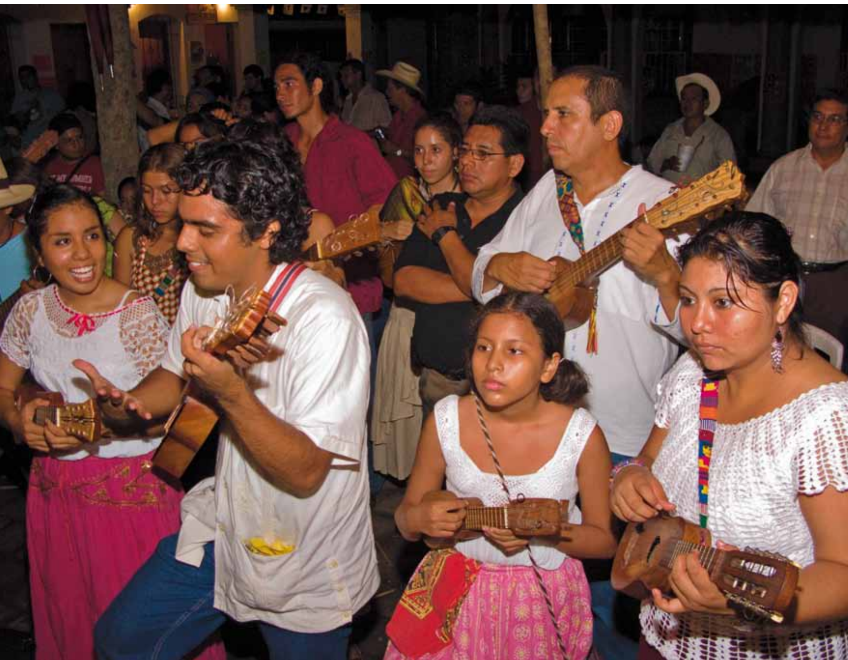
Foto 9. La mayoría de músicos y grupos de son jarocho no son profesionales, no viven de su actividad musical, lo que salvaguarda su carácter libre y espontáneo.

son ha heredado rasgos distintivos que se expresan en el carácter más rítmico, percutido y brioso que asume la música y el baile de tales regiones, en tanto que en la zona de Tlacoatlpan hallamos un tipo de son más rápido y lucido y donde la presencia del pandero, antiguamente asociado sólo con las fiestas navideñas, es casi un distintivo local.