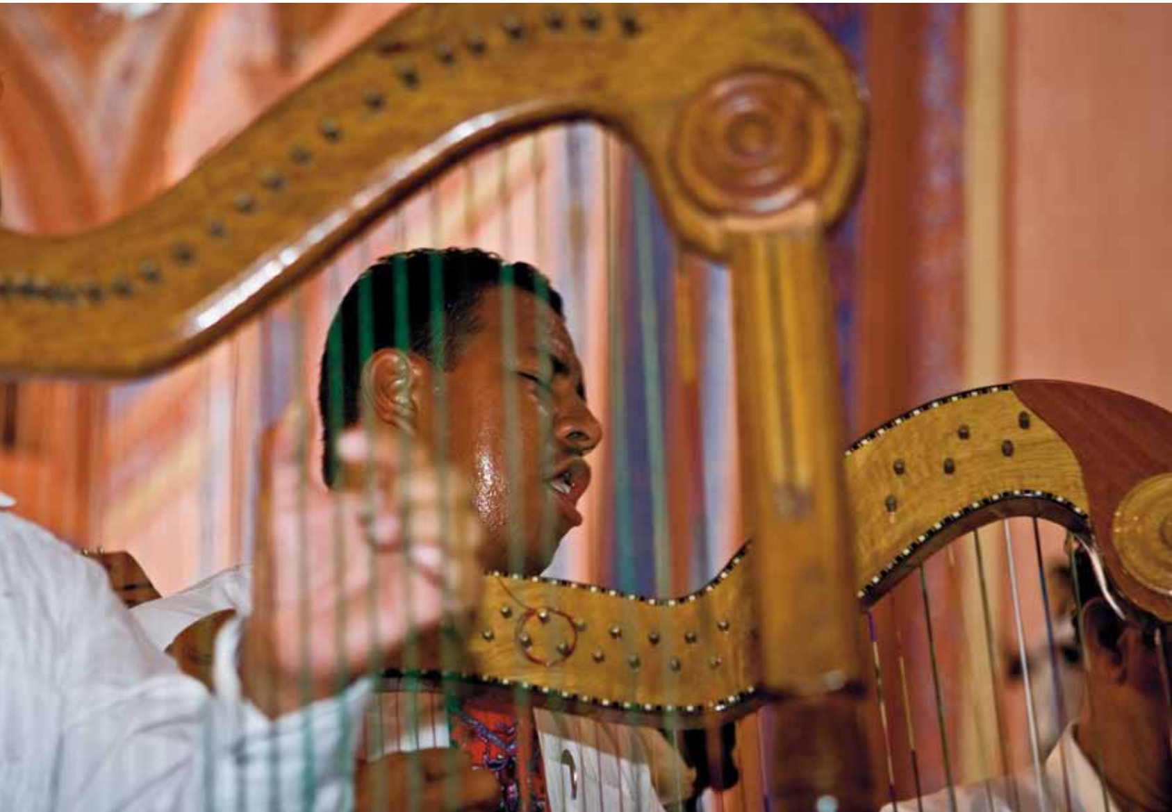
Foto 4. El arpa ocupa un lugar destacado en la música del son jarocho.

de desaparecer, ya sólo presente en los ballets folclóricos. Unos cuantos grupos porfiaban en conservar la tradición. Por eso el festival de las Huastecas de Amatlán-Naranjos es emblemático, pues marcó el inicio de un trabajo deliberado que buscaba recuperar el huapango. El primer festival de Amatlán tuvo lugar en 1990, y desde entonces se ha celebrado ininterrumpidamente y los encuentros y concursos huapangueros se han multiplicado, reapropiados por numerosas ciudades y comunidades, tanto en Veracruz como en los otros estados que conforman la Huasteca. Este género musical también tiene una presencia importante en las ciudades de Xalapa y México.