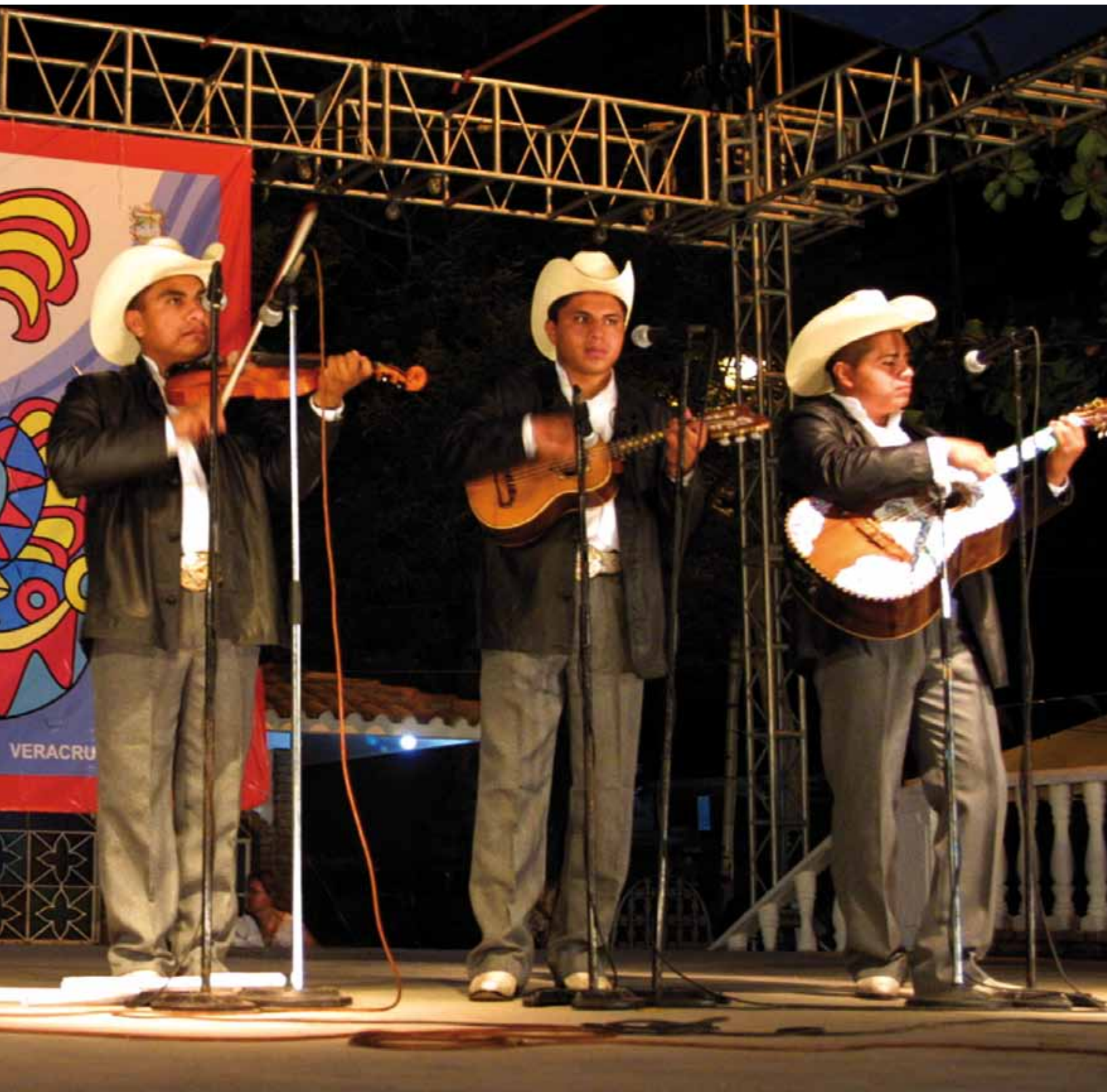
Foto 1. Presentación de un trío huasteco en Pánuco, Veracruz.