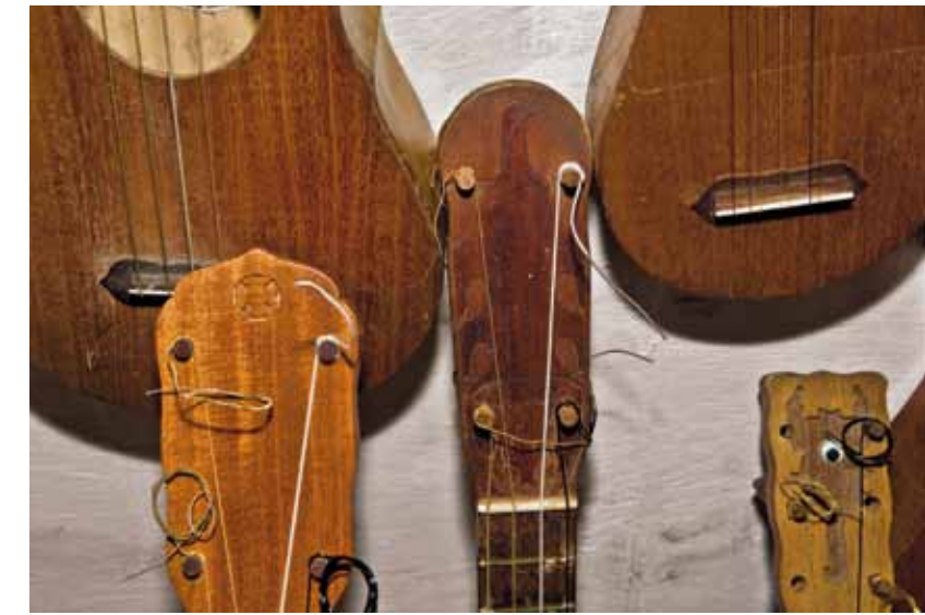
Foto 10. La dotación tradicional básica está compuesta por instrumentos de cuerda encargados de hacer la melodía y realizar el acompañamiento.

No es una exageración decir que el fandango es una “fiesta seria”, un evento social con un importante contenido ritualista, si consideramos que se ha mantenido vivo por tanto tiempo gracias precisamente a la existencia de estrictas normas, jerarquías y principios que lo regulan y determinan. El ambiente festivo se produce dentro de un reverente aunque tácito protocolo que lo mantiene bajo una espontánea, pero respetuosa regulación. Sin este elemento central de la fiesta jarocho, el fandango ya no existiría. En